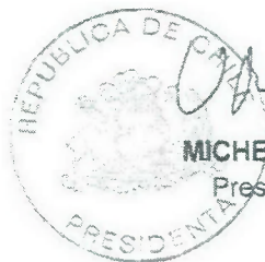
Michelle Bachelet MICHELLE BACHELET JERIA Presidenta de la República