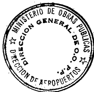
Ma. Isabel Castillo R. Arquitecta Directora Nacional de Aeropuertos Ministerio de Obras Públicas