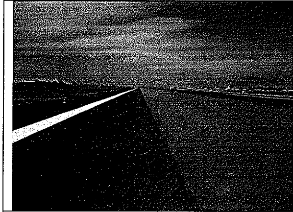
Foto N1. Pista 17 L – 35R Lado Oriente Aeropuerto Arturo Merino Benítez